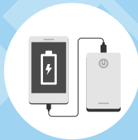
보조 배터리 여분 배터리